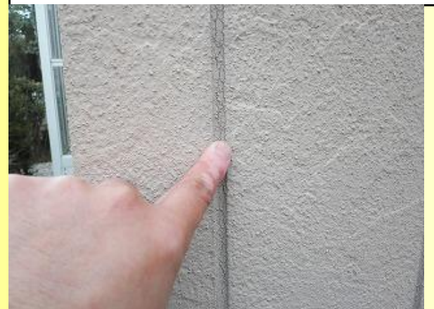
シーリング材の剥離亀裂